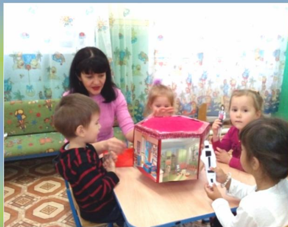
Знакомимся с национальными блюдами татарского народа