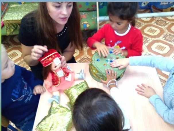
Играем в дидактическую игру «Подбери узор»

Знакомимся с татарскими народными костюмами.